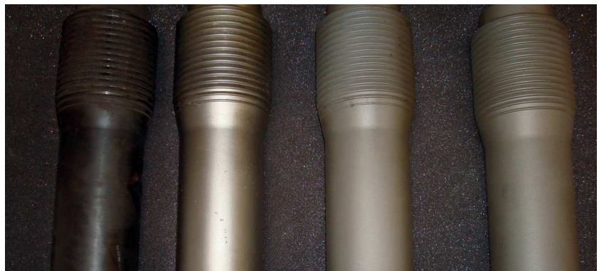
Rohzustand und Resultate mit unterschiedlichen SURFAST®-Mischungen